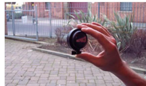
Łatwy montaż dzięki zastosowaniu samoprzylepnej powierzchni